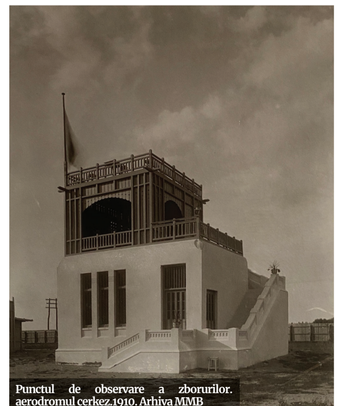
Punctul de observare a zborurilor. aerodromul cerkez.1910. Arhiva MMB

Avem artefacte arheologice descoperite aici, cum spuneam, din epoca bronzului și a doua epocă a fierului, din perioada de formare și de apogeu a culturii dacice. Evident, avem o și așezare medievală, mai veche, din punctul meu de vedere, față de atestarea ei documentară din 1709. Însă m-a surprins cât de modern a fost aerodromul ridicat în apropierea localității și avem câteva imagini inedite din interiorul său. Apoi, există aici una dintre cele mai vechi reședințe, ridicată în fața gării, la începutul secolului XX, în jurul căreia a existat o fermă organizată de familia Manole, familie ce a înființat aici, în Chitila, ziarul „Neamul Românesc”, a cărui apariție a marcat toată perioada interbelică, având ca susținători mulți profesioniști din clasa de mijloc și personalități precum Nicolae Iorga. Adresa poștală a redacției era chiar gara Chitila, iar ziarul era publicat de Societatea Anonimă pe Acțiuni Cultura Neamului Românesc, cu sediul în Chitila interbelică. Așadar, să știți, în Chitila mai sunt multe de descoperit din istoria relativ recentă.